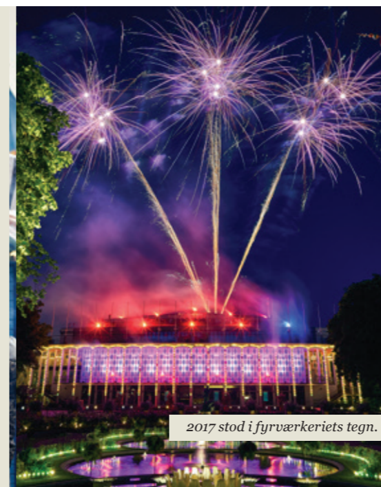
2017 stod i fyrværkeriets tegn.