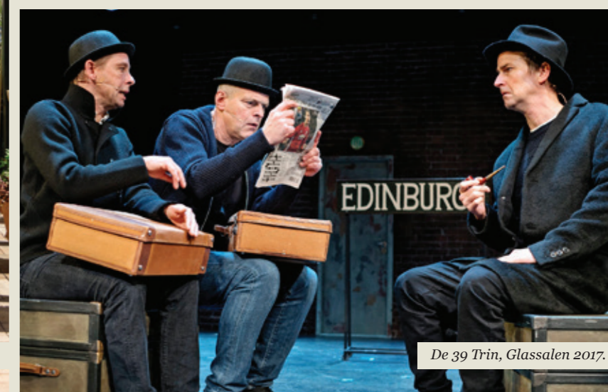
De 39 Trin, Glassalen 2017.