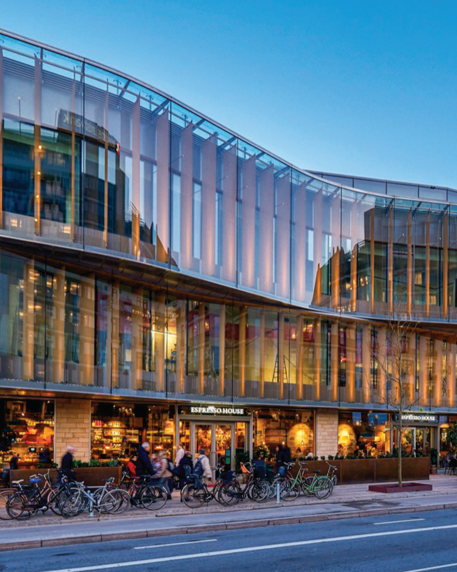
TIVOLI A/S Vesterbrogade 3 1630 København V