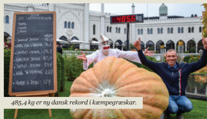
485,4 kg er ny dansk rekord i kæmpegræskar.