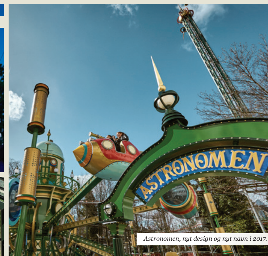
Astronomen, nyt design og nyt navn i 2017.