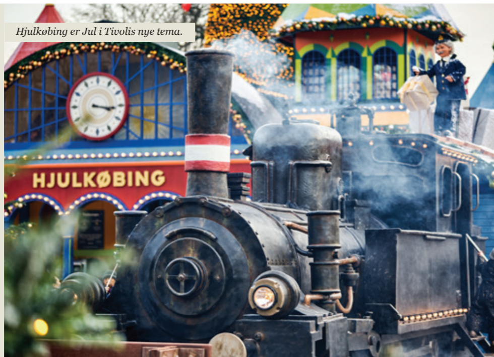
Hjulkøbing er Jul i Tivolis nye tema.