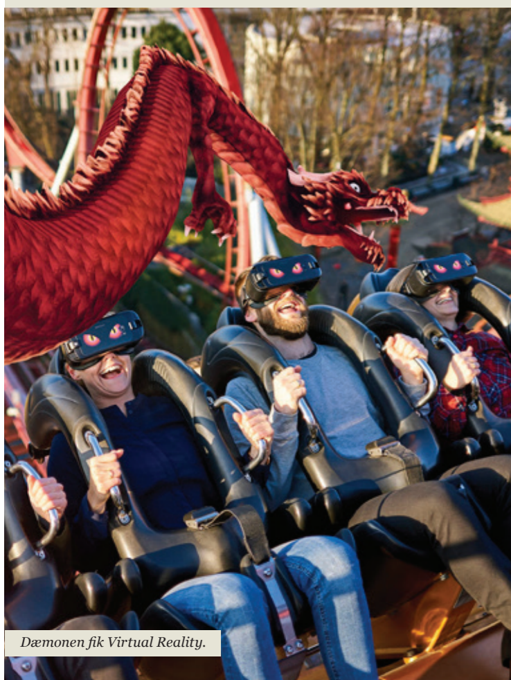
Dæmonen fik Virtual Reality.