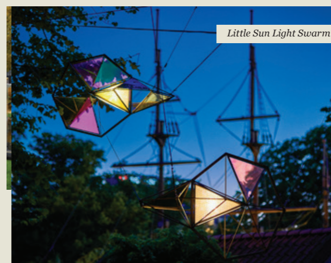
Little Sun Light Swarm