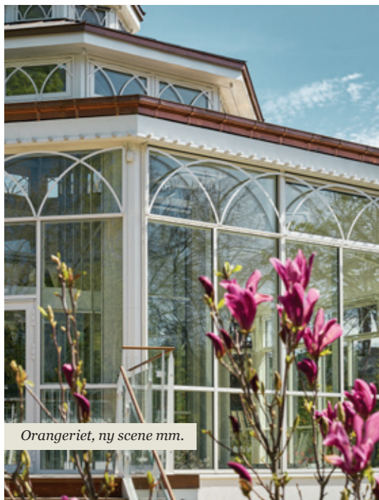
Orangeriet, ny scene mm.