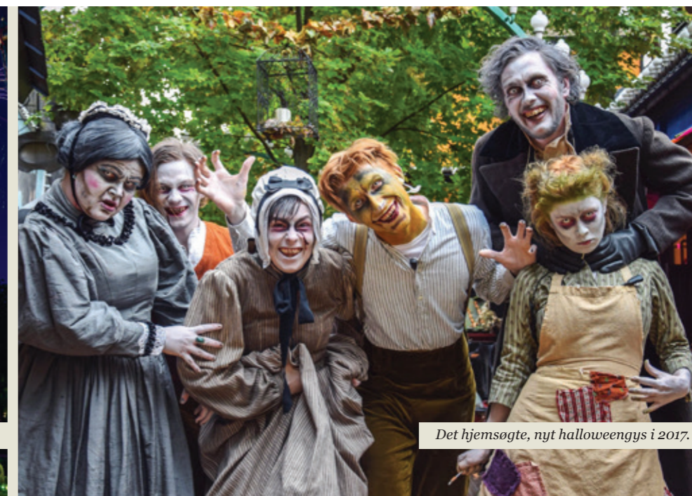
Det hjemsogte, nyt halloweengys i 2017.