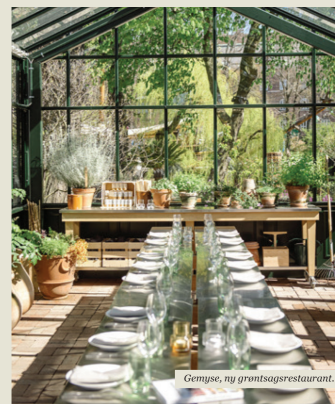
Gemyse, ny grøntsagsrestaurant.